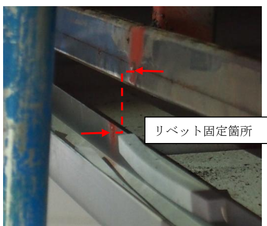
図 2-2 骨組み留め付けリベット抜け状況