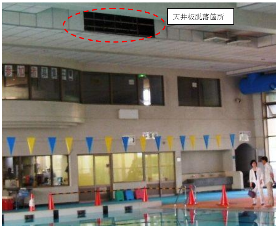
図 2-1 天井立ち上がり部脱落状況