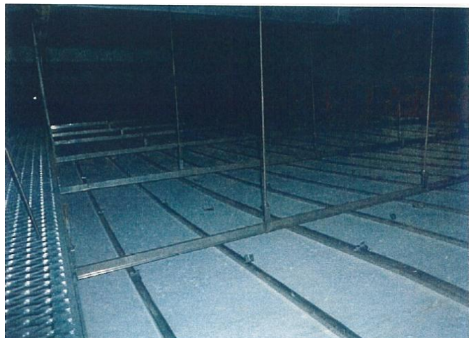
図 1 - 3 脱落部分以外の天井内クリップ外れ状況 1