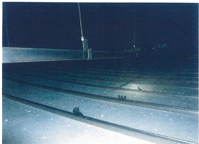
図 1 - 4 脱落部分以外の天井内クリップ外れ状況 2