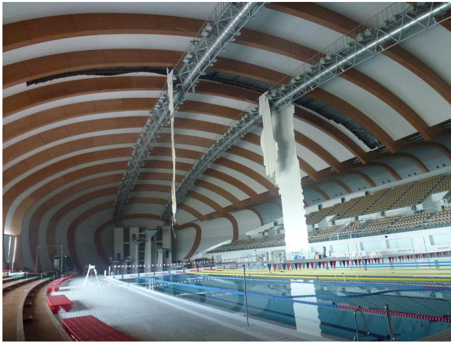
図 1 - 1 天井脱落状況