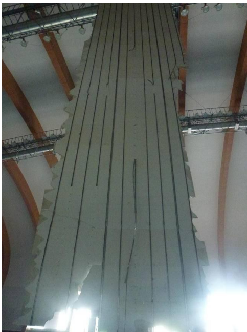
図 1 - 2 脱落した天井材