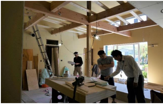
【建築中：ご確認・お打合せ】