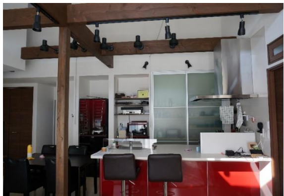
【キッチン・リビング】