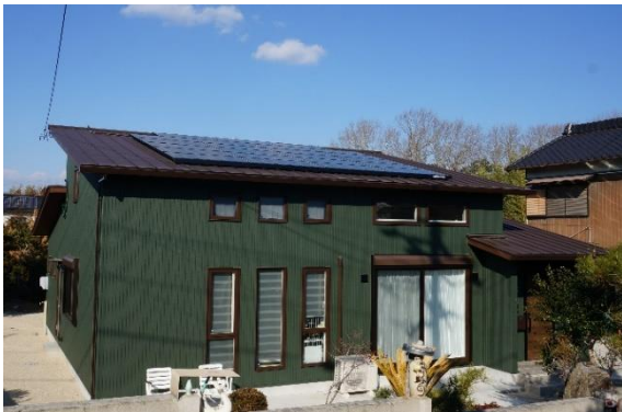
【外観と太陽光パネル】