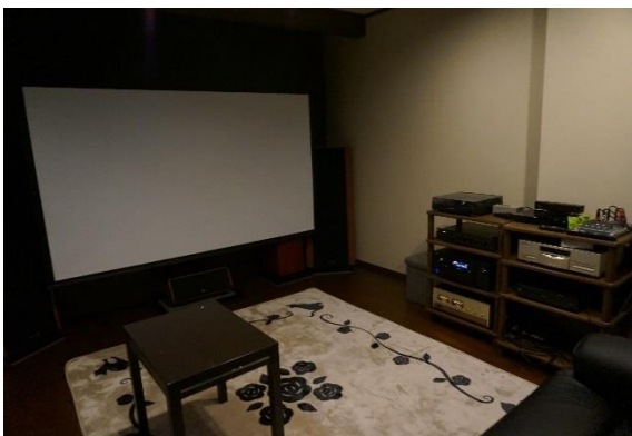
【シアタールーム：スクリーン】