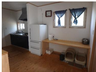
キッチン・ダイニング