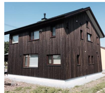
木材を外装材に用いた住宅

木材を外装材に用いて「防火構造」の大臣認定を取得できる木造高断熱外壁を開発しました。